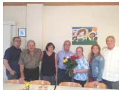
Gen.Cafe und Geburtstagskind